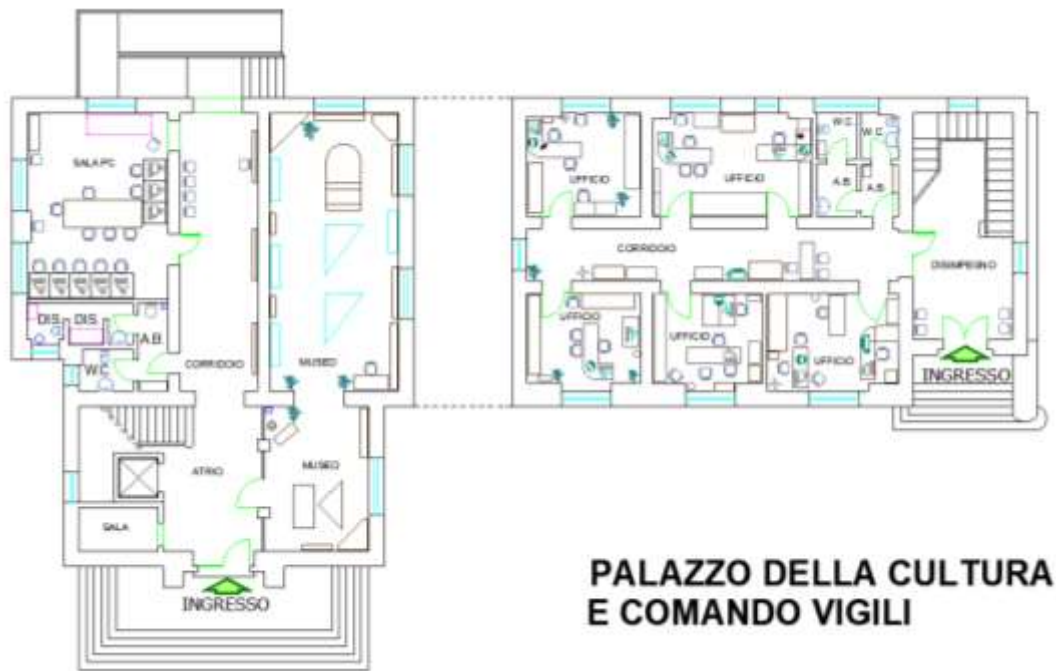
Figura 3 - Pianta Piano terra - Palazzo della Cultura